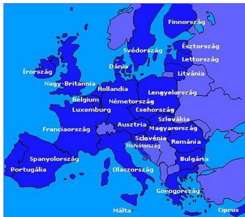
1. ábra: Az Európai Unió jelenlegi tagállamai

Az EU a világ legnagyobb segélyezője is, az EU és tagállamai nyújtják a fejlesztési támogatások több mint felét 8 (Káldyné 2010, 34. oldal).