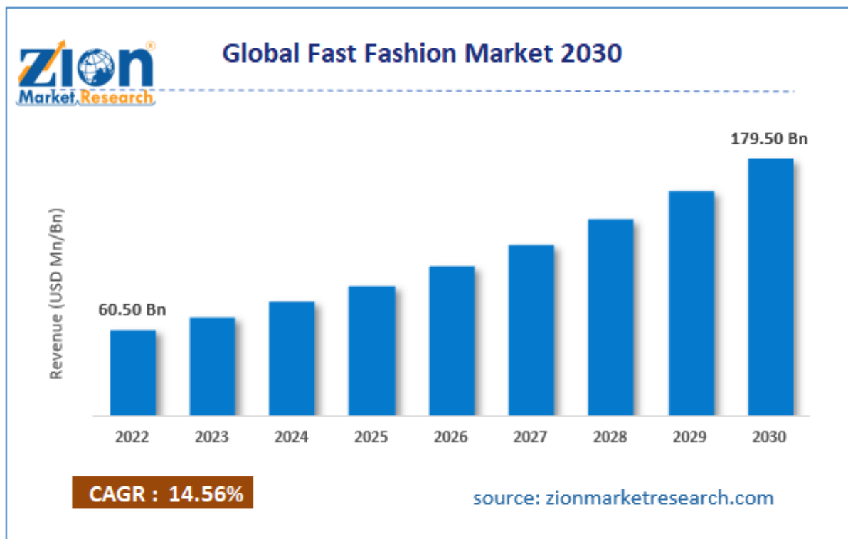
2. ábra: A fast fashion ruházat állandóan növekvő tendenciát mutat. (Zionmarketresearch.com, 2022)

A továbbra is rohamosan fejlődő ágazat évente több mint 1,5 billió dolláros forgalmat generál átlagosan és ez a szám minden évben 10-20 milliárd dollárral növekszik. Ugyanakkor a gyors növekedés súlyos környezeti és társadalmi problémákat idézett elő. A textilipar felelős a világ éves szén-dioxid-kibocsátásának mintegy 10%-áért, hatalmas mennyiségű vizet és energiát fogyaszt, és évente több mint 92 millió tonna textilhulladékot termel, amelynek csupán egy kis része kerül újrahasznosításra. ( Rashmila Maita, 2024 ) Az elavult ám sajnos mégis releváns lineáris gazdasági modell – amely a „termelj, használj, dobd el” elvre épül – már nem tartható fenn. Ez a modell nemcsak ökológiai, hanem társadalmi problémák forrása is, hiszen számos alacsony jövedelmű országban a divatipar kizsákmányoló munkaerőpiaci gyakorlatokra épít.