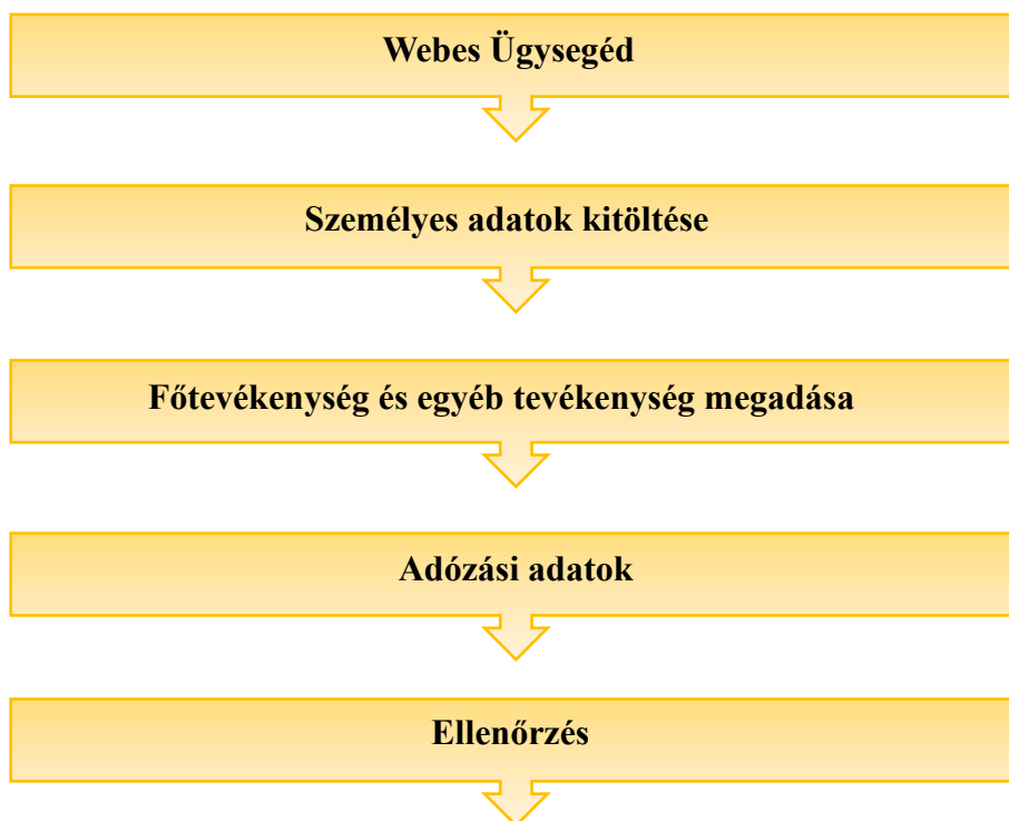
2. ábra: Egyéni vállalkozás létrehozásának online lépései Saját szerkesztés

Bármilyen regisztráció és döntéshozatal előtt fontos tájékozódni az aktuális jogszabályokról és előírásokról. Ehhez segítséget nyújthat a NAV hivatalos oldala, ahol minden szükséges és naprakész információ, adat, törvény és szabály rendelkezésre áll. Az egyéni vállalkozók különböző ügyintézéséhez is részletes leírásokat nyújt. Emellett könyvelő és/vagy adótanácsadó igénybevétele is jó döntés lehet.