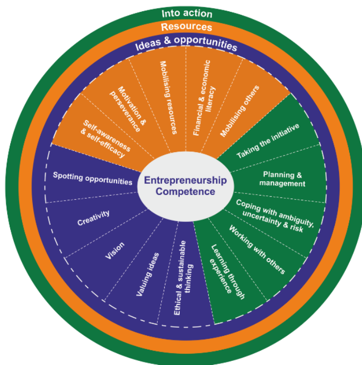
1. ábra: Entrepreneurship Competence - Vállalkozói kompetencia