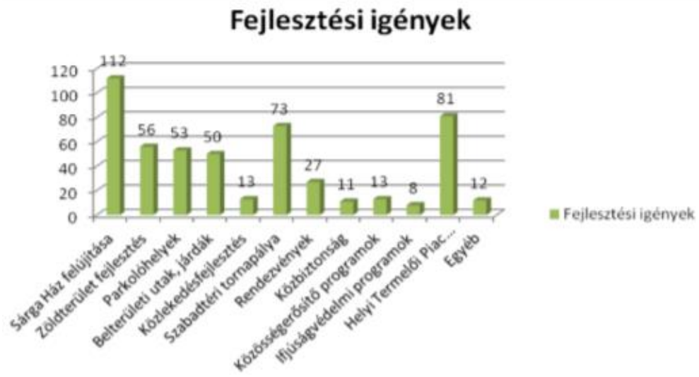
3. sz. ábra

Az első kérdőíves felmérés eredményei alapján a legfontosabb fejlesztési szükséglet a „Sárga Ház” felújítását valamint funkcióval való felruházását tartja. Az épületnek azért van ekkora jelentősége, mert a település emblematikus jelképének is számít, viszont jelen helyzetében alulhasznosított és rontja a településképet. Második helyen szerepel a helyi termelői piac továbbfejlesztése, továbbá atornapálya megvalósítása. A válaszadók közel fele tartja szükségesnek még a zöldfelületek ápolását, megújítását, a település belterületi útjainak, járdáinak felújítását, parkolási lehetőség kialakítását.